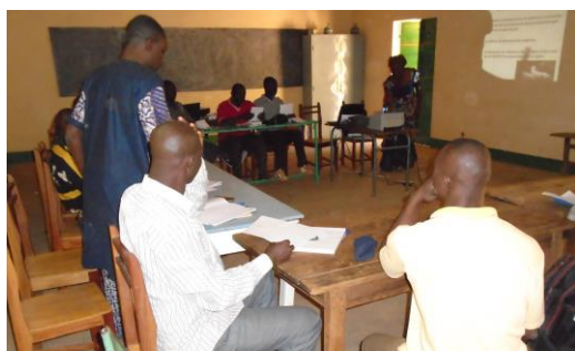
Session de formation des rédacteurs De la province de la Tapoa, région de l'Est

« Avec le Projet Neer-Tamba, j'ai accompagné environ 200 promoteurs dans la rédaction de leurs avant-projets. Je suis rédacteur depuis le PADAB II, mais c'est avec le Projet Neer-Tamba que j'ai pu consolider mes connaissances en rédaction de projets. Cette expérience m'a permis d'ouvrir un bureau où je continue d'appuyer les populations dans le montage de leurs dossiers, dans le cadre des appels à projets. Entre 2020 et 2021, j'ai monté une soixantaine de micro-projets dont la moitié a été approuvée. »