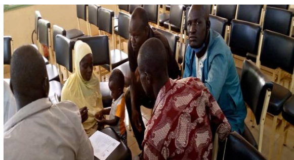
Séance de rédaction d'avant-projet dans la commune de Bogandé, province de la Gnagna, région de l'Est.