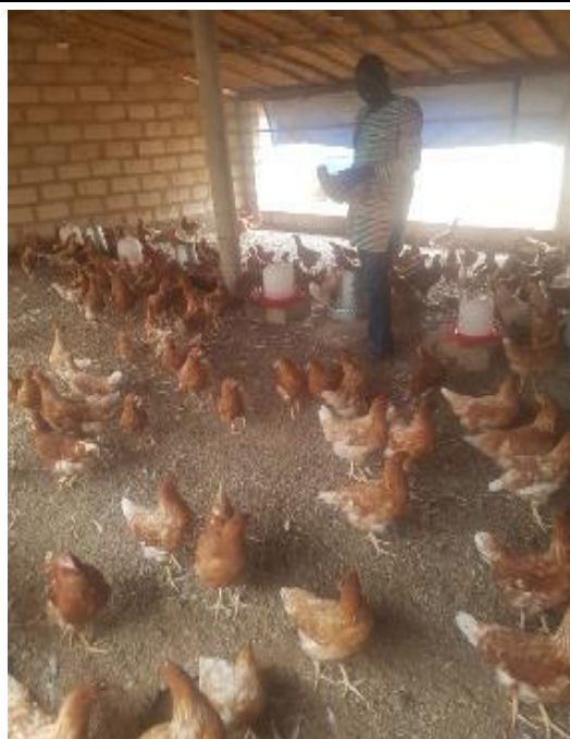
Photo 3 et 4 : Promoteur en aviculture avant et après la réalisation d'un MP

BISMOIGA Bassirou , Aviculteur, village de Tanmiougou, Commune du Korsimoro, Province du Sanmatenga, Région du Centre-Nord, / Tel : 79 44 55 67/69 18 96 28 ; Subvention Neer-Tamba de 807 285 F CFA