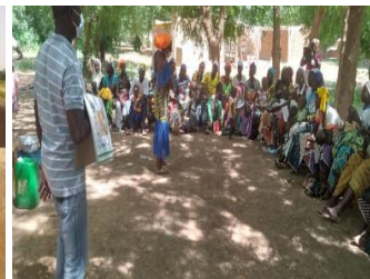
Photo 4 : Séances de sensibilisation DANS LE VILLAGE DE ROBOLO/Commune de nutrition dans le village de Ouindigui