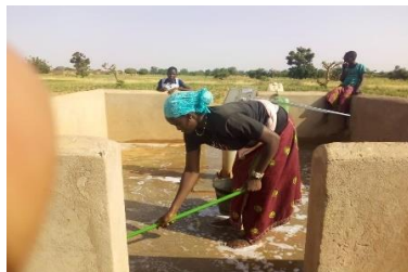
Photo 3 : SEANCES DE SENSIBILISATION SUR LE sur le thème de l'hygiène dans le village de Robolo/Commune de Ouindigui