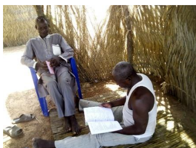
Photo 3: Séance de lecture dans le village de Ouazelé, commune de Sabcé