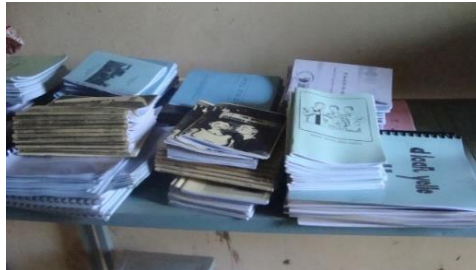
Photo 2: vue partielle de la documentation de la biblio-moto du Bam