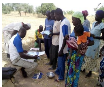
Photo 4: Séance de location dans le village de Pittenga, commune de Rouko