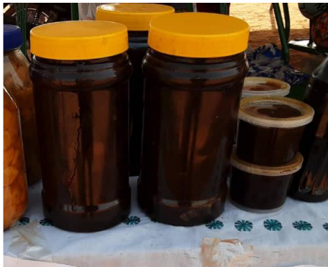
Confiture de Saba senegalensis