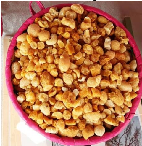
Gomme arabique de Accacia senegal