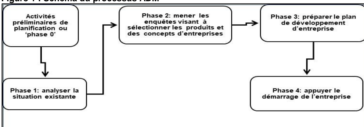
Figure 1 : Schéma du processus ADM

L'approche ADM est un cadre de planification des entreprises pour la valorisation des produits forestiers non ligneux. Elle est composée d'une phase préliminaire de planification suivie de quatre (04) autres qui guident les entrepreneurs à travers un processus participatif de planification et de développement d'entreprises. Les entrepreneurs sont guidés à travers Ces différentes phases qui garantissent l'inclusion de tous les éléments cruciaux au développement de leurs entreprises tout en minimisant les risques. La figure ci-dessous décrit succinctement les différentes phases de l'approche.