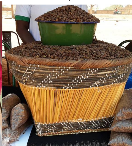
Grain de Accacia macrochtachia

AMELIORATION DES PERFORMANCES DES ENTREPRISES RURALES DE PRODUITS FORESTIERS NON LIGNEUX PAR L'APPROCHE « ANALYSE ET DEVELOPPEMENT DES MARCHES »