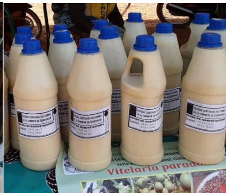
Beurre de Vitalaria paradoxa